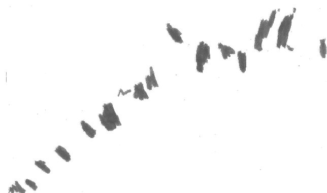
“La fila di castagne...” Michela 2, 6 anni

Per la richiesta occorre compilare l'apposita domanda online ( http://www.comune.casalgrande.re.it —ISCRIZIONI ON LINE) indicativamente nel mese di marzo.